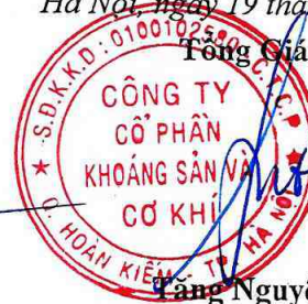
Tăng Nguyên Ngọc

(Các thuyết minh từ trang 10 đến trang 35 là bộ phận hợp thành của BCTC)